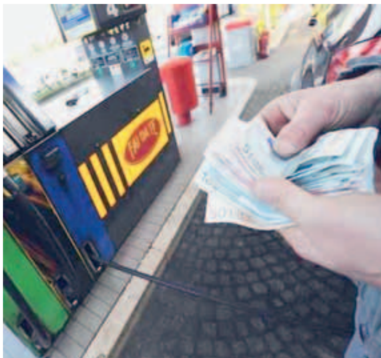
Timori per le ricadute sui consumi degli italiani dell'aumento dell'Iva