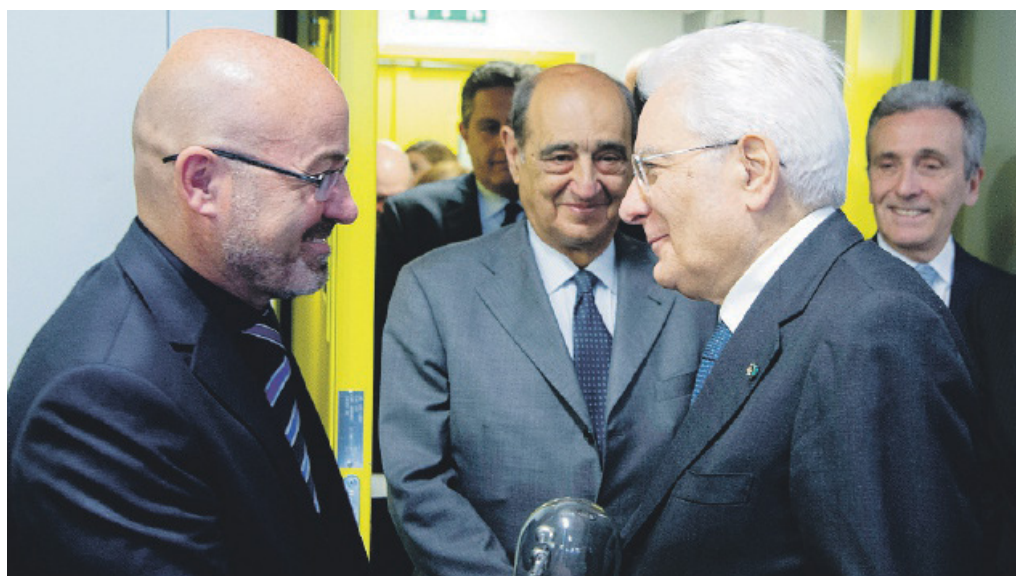
PRESTO IN CITTÀ Roberto Cingolani (a sinistra, in foto, con il presidente Sergio Mattarella), sarà ospite dell'associazione "Comunicare l'informazione" venerdì 14 luglio alle 17.15, ad Alessandria

Rete e social? Il dato di fondo è l'accettazione della sfida